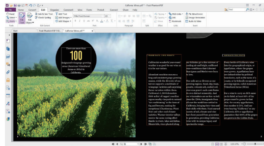
Bearbeiten von Inhalt und Layout wie in einem Textverarbeitungsprogramm