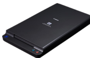
Unité de numérisation à plat A4 102

Numérisez des livres reliés, des journaux et des supports fragiles en ajoutant l'unité de numérisation à plat 102 pour les documents allant jusqu'au format A4, ou l'unité de numérisation à plat 201 pour la numérisation de documents A3. Connectés par USB, ces scanners à plat fonctionnent en toute transparence avec le modèle DR-C225 II (uniquement) avec une numérisation double fluide qui permet d'appliquer les mêmes fonctions d'amélioration de l'image à toute numérisation.